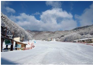
藪原高原スキー場