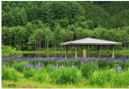
あやめ公園池 大平、スキー場南から 徒歩ですぐ