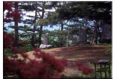
鳥居峠 青年の家から 徒歩ですぐ