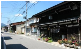
藪原宿 藪原宿は藪原駅から徒歩数分 鳥居峠は藪原駅から徒歩20分程度