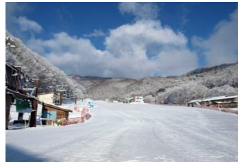
藪原高原スキー場