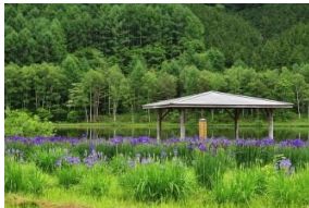
あやめ公園池 大平、スキー場南から 徒歩すぐ