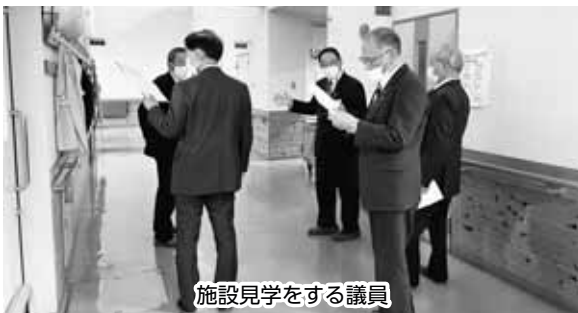
施設見学をする議員

コロナ禍が過ぎて、ようやく念願の郡内の高齢者施設を見学できた。公と民の施設感覚とサービスのあり方や職員の対応を改めて知ることができ良かった。今後の介護保険サービスの充実を願いつつ更なる研修を重ねていきたい。