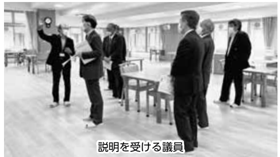
説明を受ける議員

*措置費施設：行政が「やむを得ない理由」により自宅での生活が困難と判断した人に対し、入所やサービス利用の措置（行政処分）をとる施設のこと