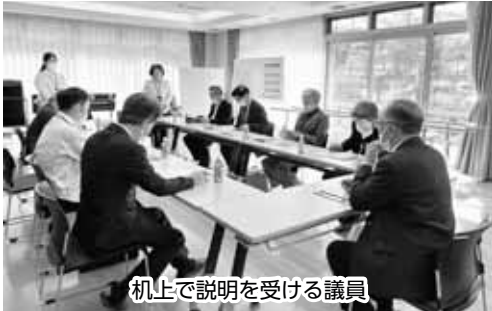
机上で説明を受ける議員