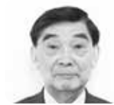
やすはら かよ 安原千佳世 議員