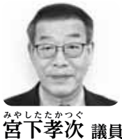
みやしたたくし 宮下孝次 議員

提案 学生時代に多くの留学生と交流し、外国の方と親しくなり老人福祉センターの結婚式にも来ていただいた。会話を通じ子どもの頃から分からなかった小木曾地区の言葉の意味が分かるようになった。ほんの小さなことでも経験となる。積極的な海外交流を考えていただきたい。