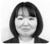
しみず あり子 議員