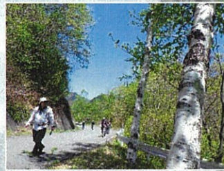
●堤体の上にも沢山の人が集まりました