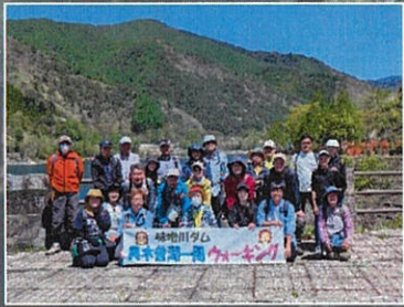
●空の青と山の緑が眩しいくらいに美しい

5月10日(日)、味噌川ダムの『管理開始30周年・点検放流』合わせて、「ハイキング」イベントを開催しました。新緑のダム湖畔を、静岡・岐阜・群馬・埼玉や村内外からの参加者22名と引率者4名で歩きました。道中ではダムの説明を受け、山菜採りも楽しみました。正沢親水公園で昼食をとった後、第2部の放流に間に合うよう管理所へ向かい、堤体から迫力ある放流を見学しました。下から見るのとは違い、上部からの放流は吸い込まれるような錯覚に陥ります。今回は特別な放流見学付きのハイキングとなりましたが、参加者の皆さんからは「また来たい」「次回も楽しみ」といった声も頂きました。新緑の季節ならではの奥木曾湖の景色を、次回はぜひあなたもご一緒しませんか。ご参加頂きありがとうございました。