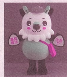
長野県消費者被害防止啓発キャラクター もしかっち