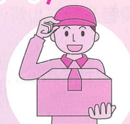
(消費者庁イラスト集より)