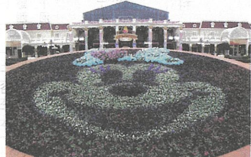
いつもはミッキーマウスですが、ミニマウスでした。春はすぐそこ！