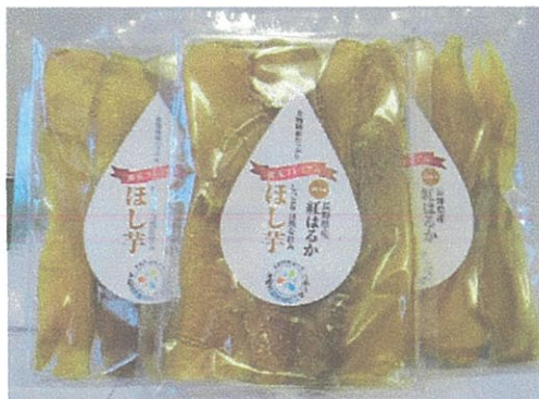
木祖村農産物加工センターで加工した「ほし芋」