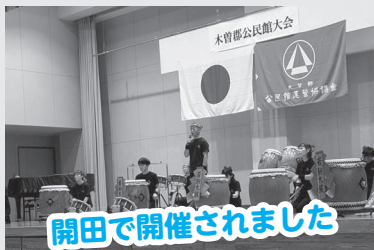
11/9(日)木曽郡公民館大会

年も明け、令和7年度の事業もわずかとなりました。今回は前号以降での事業報告となります。公民館では、村民文化祭において展示会や芸能祭にお出でいただいた皆さんからの貴重なアンケート結果を踏まえながら次年度事業計画を策定しています。少子高齢化等、事業遂行にはさまざまな課題もありますがしっかり事業展開していきます。