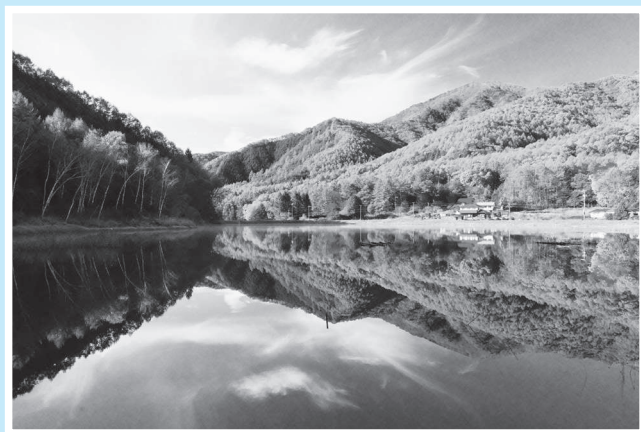
最優秀作品「夜明けの秋映」

今年で11回目となる紅葉のフォトコンテストを開催しました。今年の紅葉は7日～10日ほど遅くなった分、締め切期間が実質的に短くなり、また紅葉する樹木のメインとなる楓と銀杏の色付きが悪く、応募数の激減を覚悟していましたが、72作品の応募がありいつもよりすこし少ない程度の数に留まりました。天然林やカラ松林の色付きがいつにもなくきれいで重厚であった為と思われ、実際の応募作品や入賞作品も多数がこの写真でした。今秋は天然樹とカラ松の紅葉に桧の深緑が対比する景色がどこを向いても見られる、木祖村らしい秋でした。