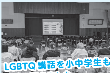
11/11(火)平和と人権講演会