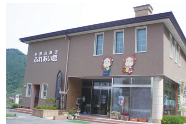
味噌川ダム防災資料館(木曾川源流ふれあい館)