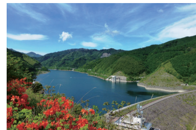
味噌川ダム(奥木曾湖)