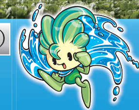
木祖村イメージキャラクター 「源流の源気くん」