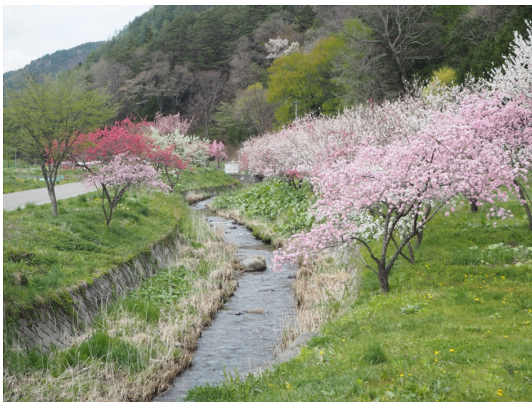
水と自然が豊かな木祖村の風景