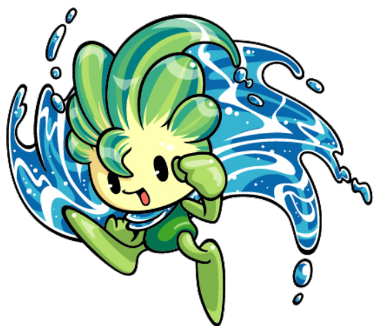
木祖村イメージキャラクター源気くん