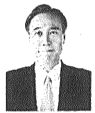
長野県知事 阿部 守一

新型コロナの感染拡大防止にご協力いただいている皆さまに、改めて感謝申し上げます。しかしながら、新年に入ってから本県においても急速に感染が拡大し、医療提供体制が逼迫しています。早急に新規陽性者数を減少に転じさせなければ、救える命が救えなくなるおそれがあるため、全県に「医療非常事態宣言」を発出し、対策を強化します。大切な命と暮らしを守るため、皆さまのご協力をお願い申し上げます。