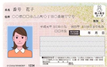
▲個人番号カード（表）