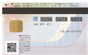
▲個人番号カード（裏）